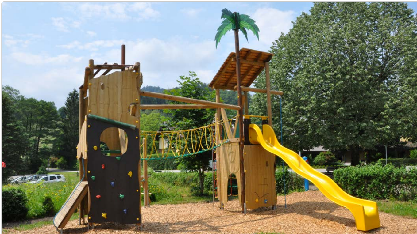
35850 Urwaldkombination Xingu, ohne Rutsche