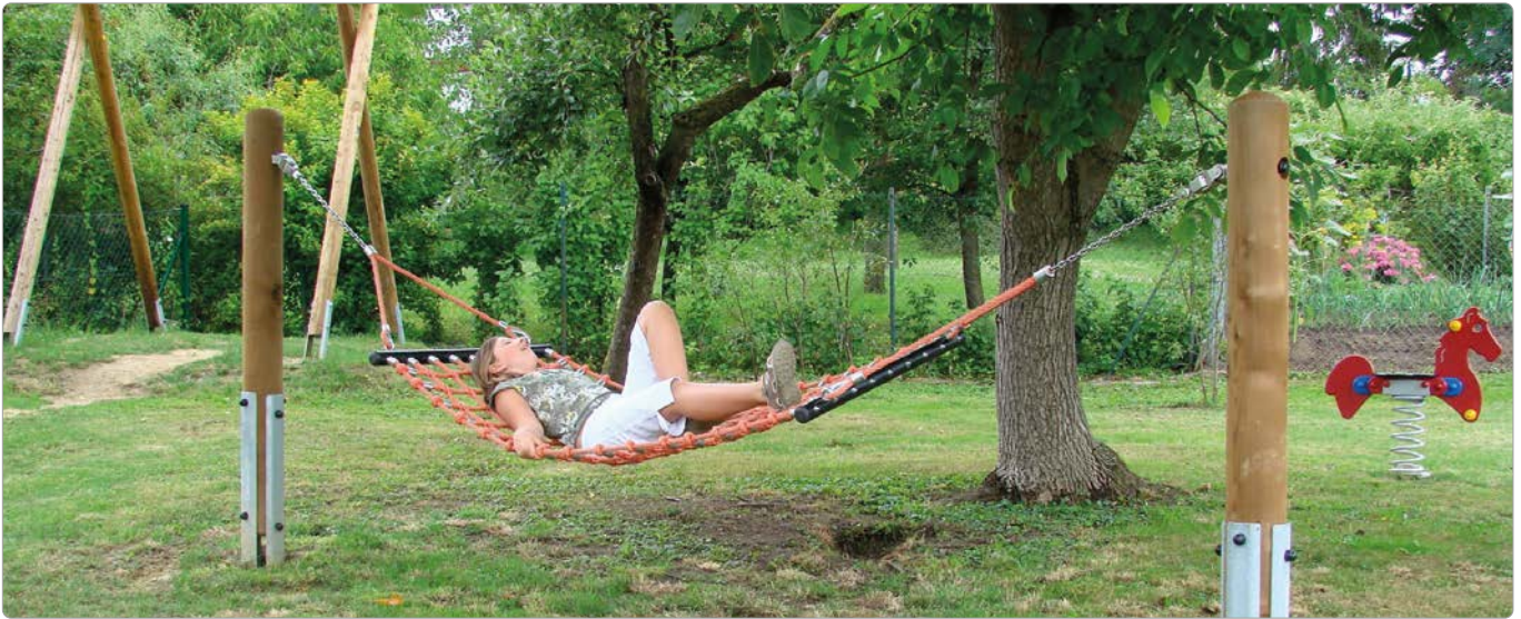
45270 Hängematten-Schaukel, mit Stahlseilnetz und Holzstehern