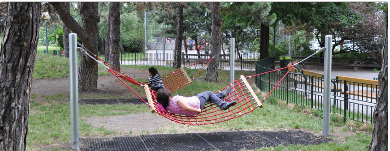
45272 Hängematten-Schaukel, mit Stahlseilnetz und Stahlrohrstehern