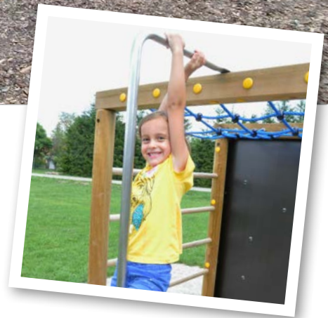
48051 Klettersechseck mit Netztrichter