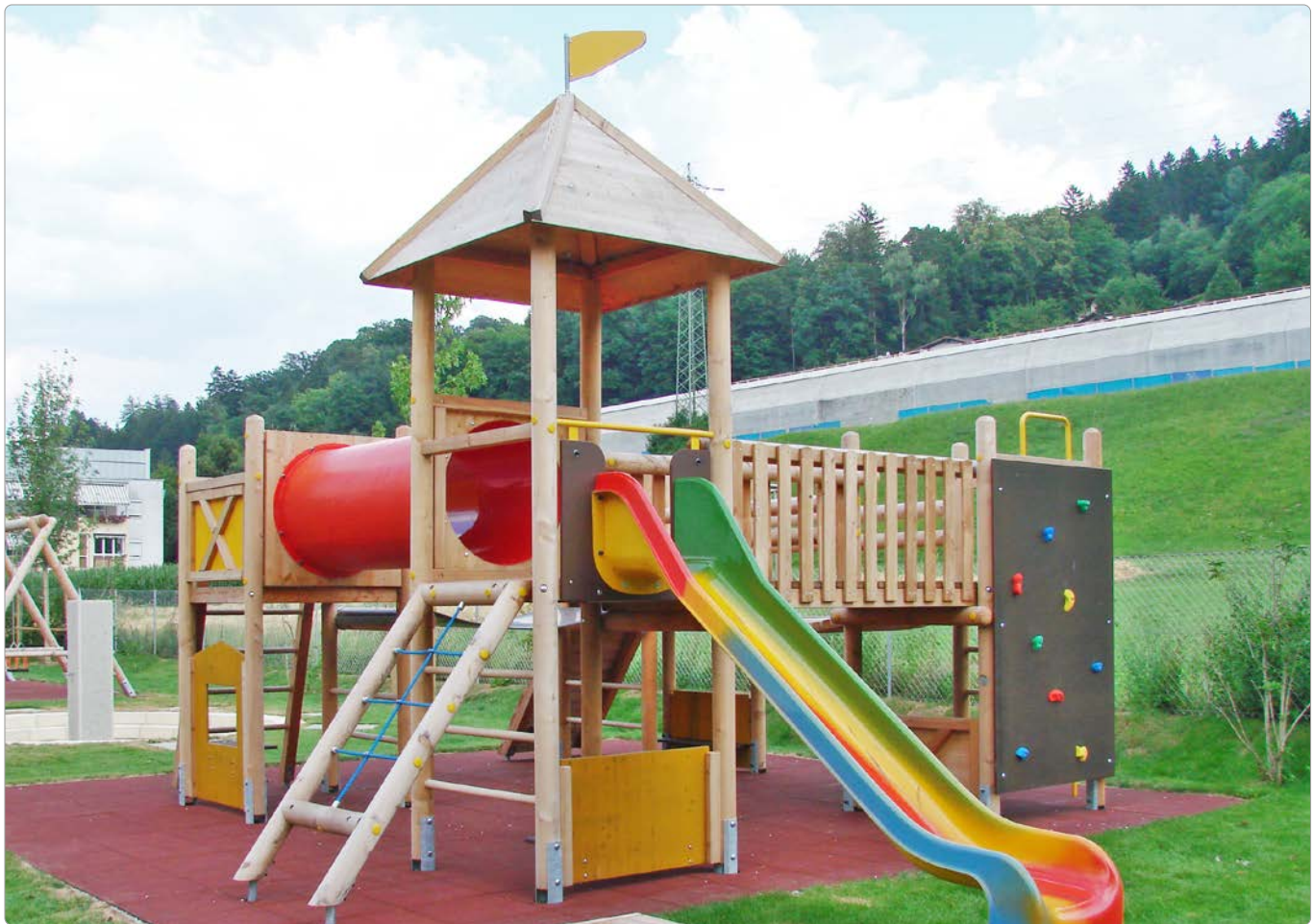
54000 Turmanlage Schorndorf, ohne Rutsche